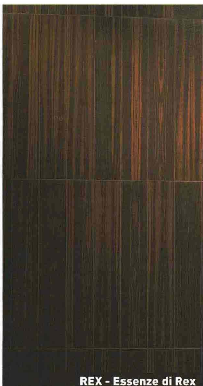
REX - Essenze di Rex