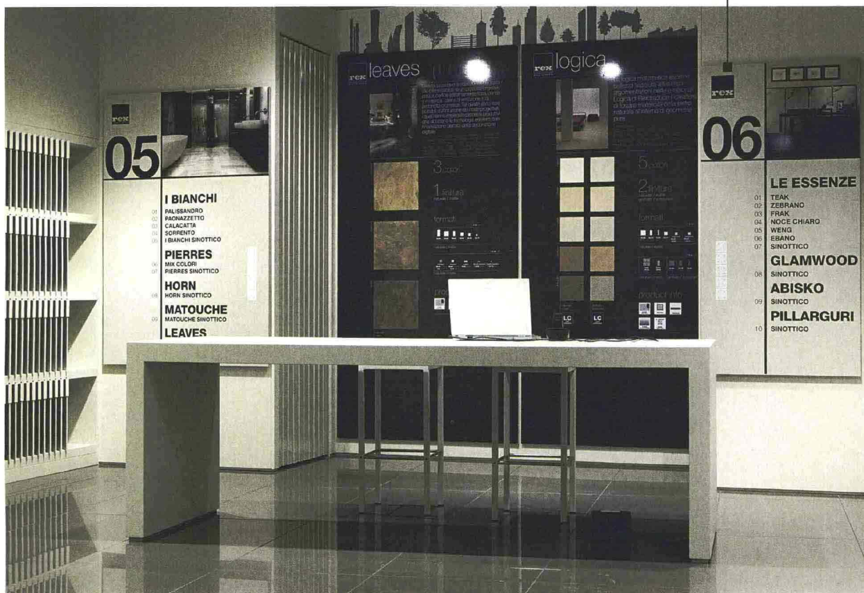
FLORIM BY MAKRO

LA TECNOLOGIA - Florim Ceramiche, grazie all'esperienza Makro, ha dato vita ad un sistema bagno che concepisce in maniera innovativa l'uso delle superfici in ceramica. Il fulcro è la forte integrazione tra i rivestimenti e gli elementi strutturali del progetto come vasche, docce e lavabi. I prefabbricati modulari sono leggeri, di facile e veloce installazione. I vantaggi sono: risparmiare tempo sul cantiere, ridurre i costi di installazione e un grande impatto estetico. È una soluzione su misura, studiata per essere adattata a molte interpretazioni progettuali, fornendo anche materiali fuori standard. Committenti e progettisti possono in questo modo dare al bagno la forma che più desiderano.