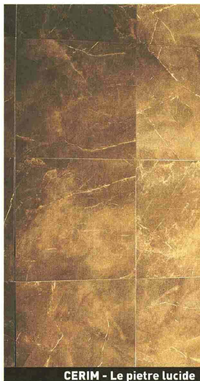
CERIM - Le pietre lucide