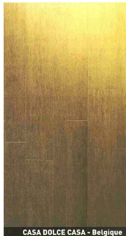
CASA DOLCE CASA - Belgique