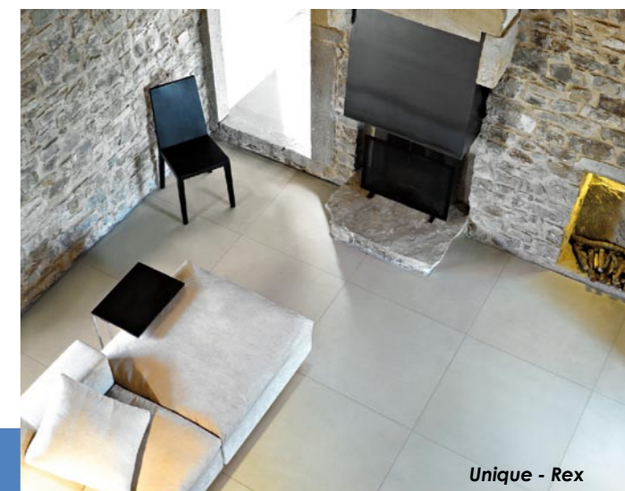
Unique - Rex