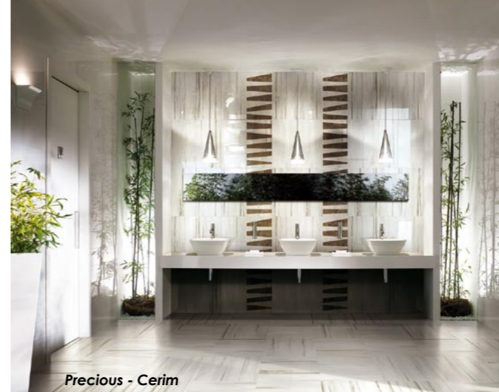
Precious - Cerim

«Florim prevede di chiudere il 2010 con un incremento di fatturato superiore al 5%: parliamo di un ammontare complessivo che dovrebbe avvicinarsi ai 290 milioni di euro, distribuiti un po' in tutto il mondo». Sono le parole dell'Amministratore Delegato Luca Bulgarelli, che espone dati incoraggianti in un anno, come quello che si sta concludendo, avaro di soddisfazioni per il settore delle costruzioni. A sostenere le buone performance dell'azienda contribuisce in maniera determinante Florim USA: «La nostra consociata ha uno stabilimento produttivo in Tennessee e una presenza massiccia in Nord America - spiega Bulgarelli - In questo momento sta ottenendo performance molto buone, con una crescita sul mercato superiore al 20%». Gli altri marchi dell'azienda (Floor Gres, Rex, Cerim e Casa dolce casa), i cui prodotti sono