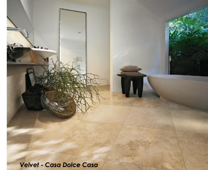
Velvet - Casa Dolce Casa

realizzati negli stabilimenti italiani, «chiuderanno il 2010 in positivo; ovviamente non con numeri paragonabili a quelli di Florim USA, ma che nel complesso consentiranno a Florim di raggiungere un risultato di tutto rispetto. A ciò si unisce un risultato economico che dovrebbe essere almeno doppio rispetto a quello del 2009, se non addirittura superiore».