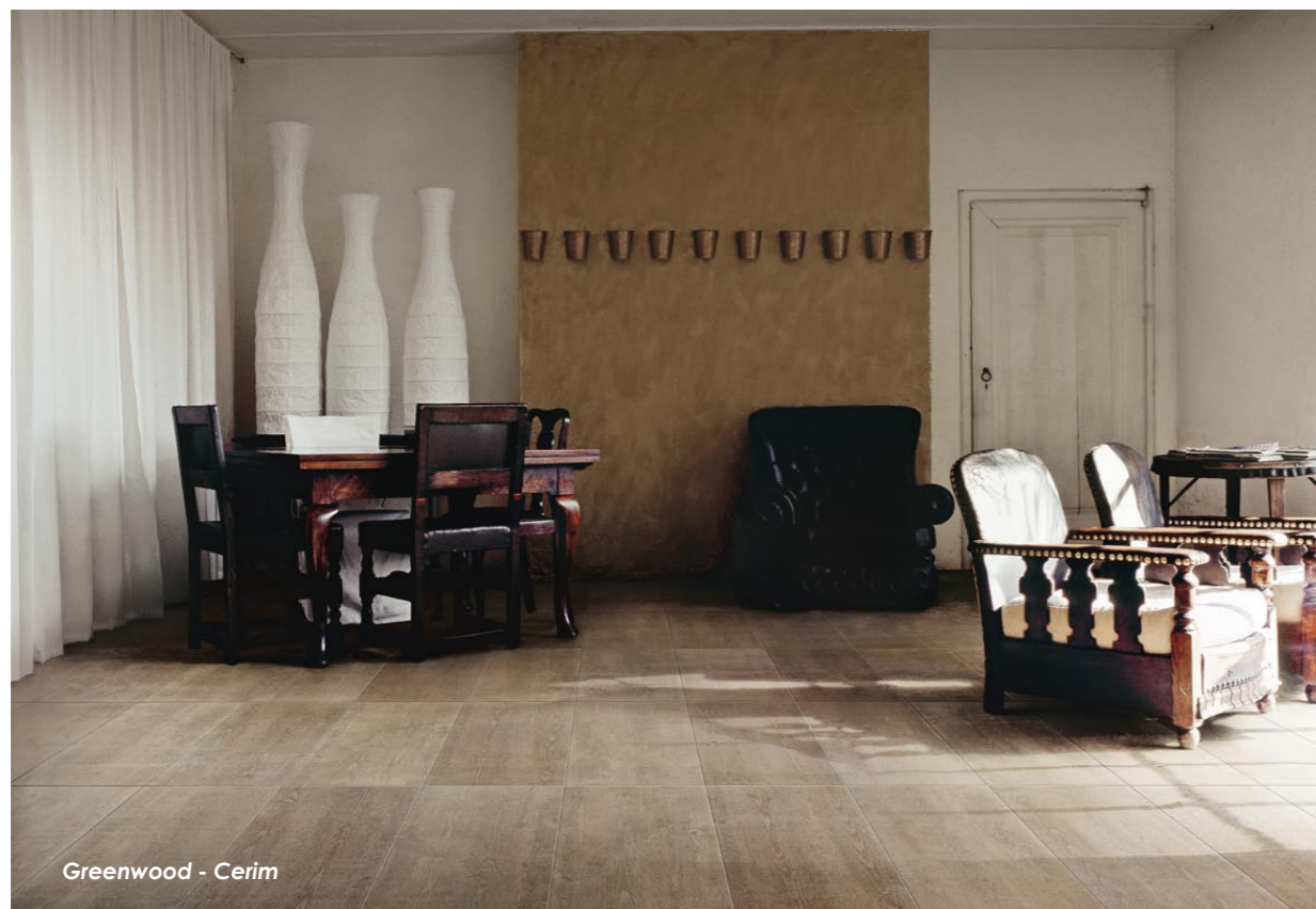
Greenwood - Cerim

Il 2010 chiuderà con incrementi di fatturato oltre il 5%. La controllata Florim USA fa segnare una crescita sul mercato superiore al 20%