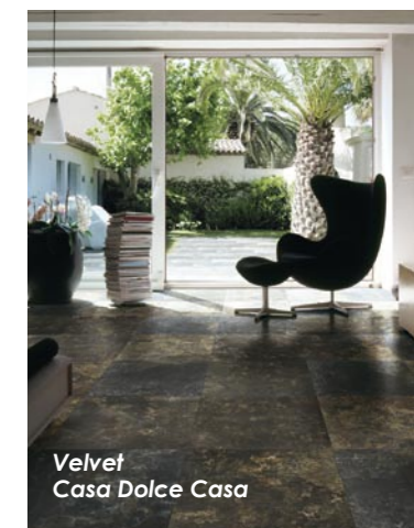
Velvet Casa Dolce Casa

L'offerta Florim comprende anche Cerim, il marchio più generalista dell'azienda, che si colloca nella fascia media del mercato con un'offerta molto ampia di materiali coordinati da pavimento e rivestimento: «Quest'anno abbiamo fatto un grande sforzo con Cerim: abbiamo infatti lanciato ben sette collezioni in un periodo temporale molto ridotto, 6 mesi, proprio perché si sentiva l'esigenza di ridare nuova linfa a questo marchio che negli ultimi anni ha mostrato qualche segnale di sofferenza. Devo dire che il ventaglio di offerte che sono state presentate ci sta dando grandi soddisfazioni».