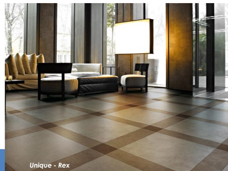
Unique - Rex