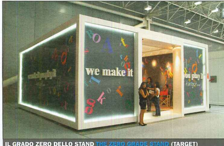
IL GRADO ZERO DELLO STAND THE ZERO GRADE STAND (TARGET)

Uno stand di «grado zero», dimensioni contenute, ben evidente all'esterno, staccato da terra con una linea d'ombra e due gradini. Dentro, un piccolo e vivace «monumento» al centro, attorno al quale c'è spazio per sedersi.