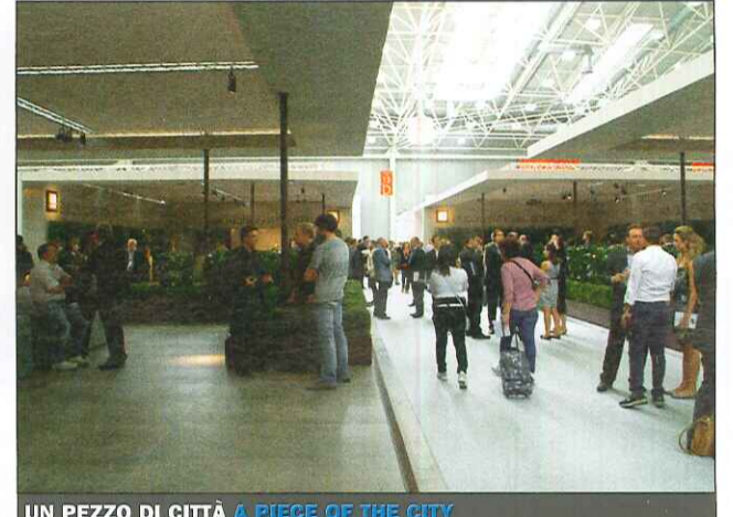
UN PEZZO DI CITTÀ A PIECE OF THE CITY (CASA DOLCE CASA, FLOOR GRES, CERIM, REX)

Quattro stand, brand di un gruppo, segnano l'incrocio di due percorsi e descrivono quattro spazi di sosta coperti e con molto verde, quasi memoria d'interno urbano. I «corpi di fabbrica» contengono stanze allestite, trasposti frammenti di luoghi realizzati.