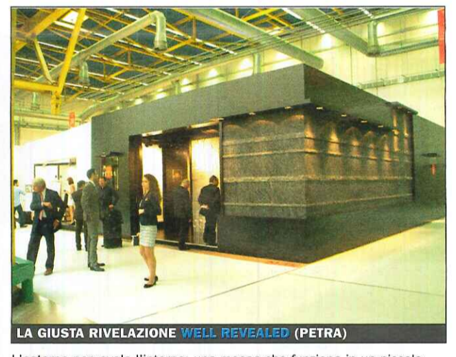
LA GIUSTA RIVELAZIONE WELL REVEALED (PETRA)

Two stands placed face-to-face, separated by a street; an urban story, "façades" like pleasantly lively and adequately transparent masks; behind them the "building units", opaque, keeping the rich collections to themselves.