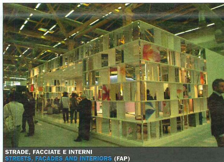
STRADE, FACCIATE E INTERNI (FAP)

Due stand face-to-face, a dividerli la strada; una storia che viene dalla città, le «facciate» come maschere piacevolmente vivaci e adeguatamente trasparenti; dietro i «corpi di fabbrica», opachi, a tener dentro tutta la diversità del campionario.